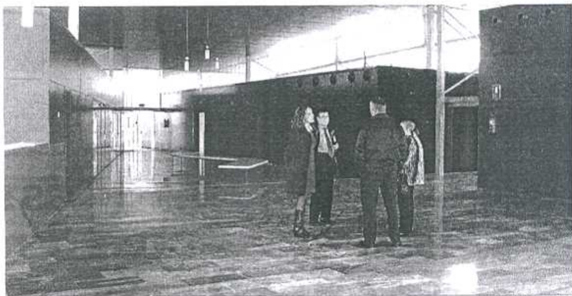
Amplio hall del centro donde se ubican dos oficinas, las cuatro salas del vivero y dos salas para formación.

Dentro de los 2.600 metros cuadrados de superficie útil distribuidos en dos plantas, los vecinos no sólo de Los Almendros, sino de los barrios colindantes, como Araceli o Piedras Redondas, van a disfrutar de ludoteca-guardería, biblio-