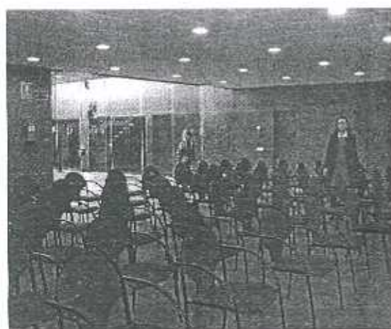
Sala de conferencias con capacidad para 100 personas.

Y es que uno de los usos que tendrá este centro consiste en la